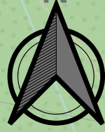
Схема розташування території детального плану території в системі планувальної структури населеного пункту М 1:5000